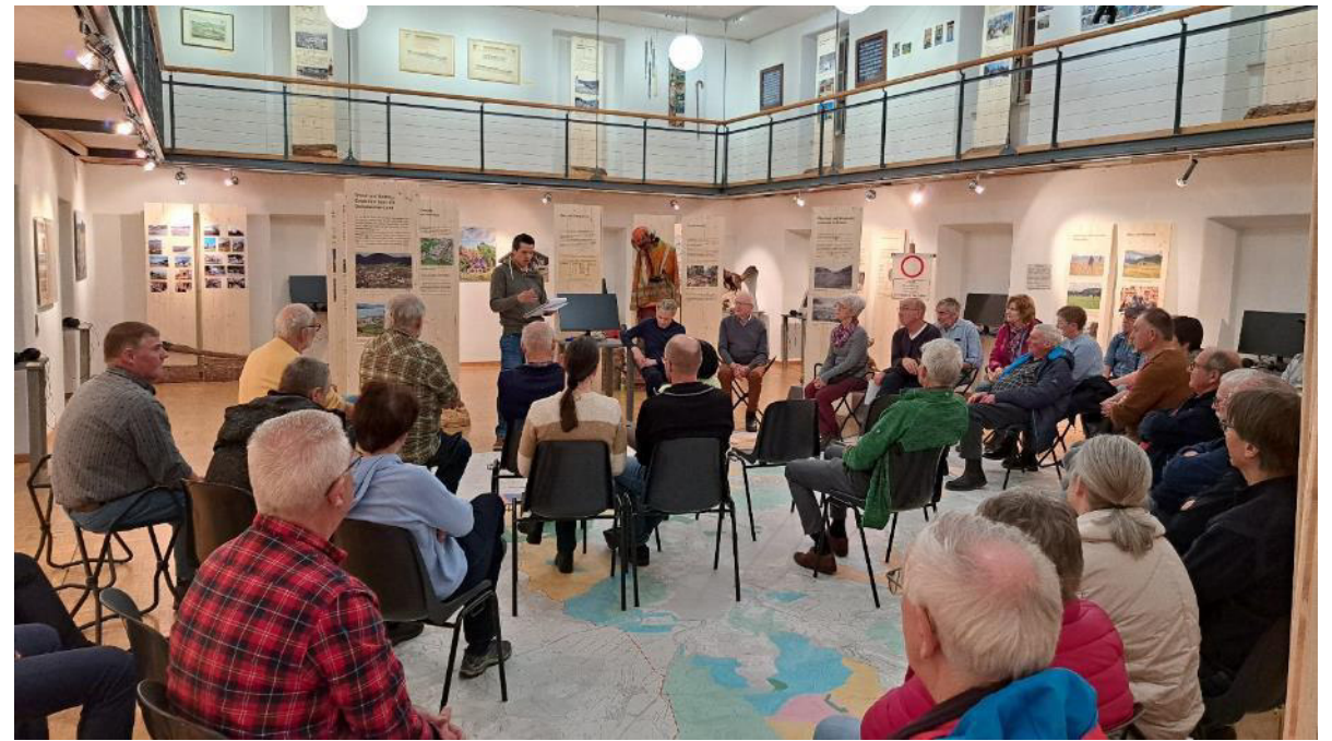
Der Betriebsförster erzählt von seiner Arbeit