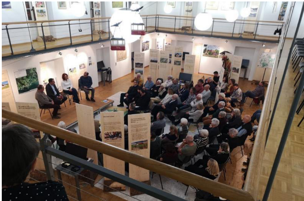
Dreikönigs-Matinée Gesprächsrunde im Chärnehus