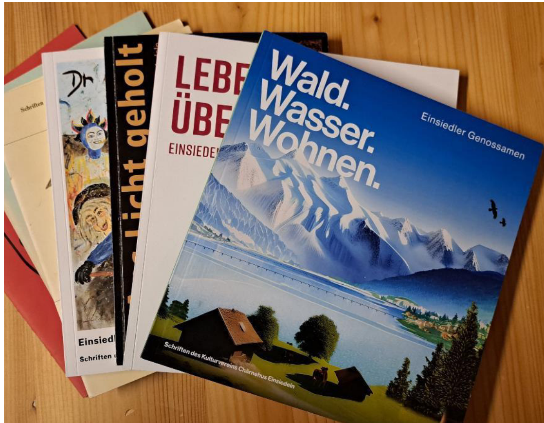
47. Nummer der Reihe «Schriften des Kulturvereins Chärnehus Einsiedeln»