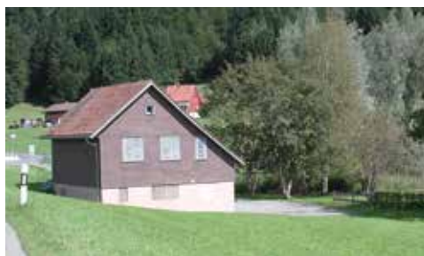
Staumauerstrasse 22 8847 Egg SZ