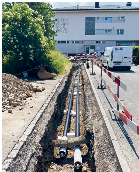
Neubau Fernwärmeanschluss Wohnbau- genossenschaft Pro Familia, Mythenstrasse