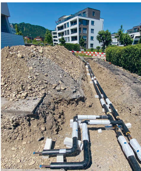
Neubau Fernwärmeanschluss Mythenstrasse 28