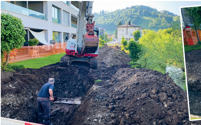
Baustelle Fernwärme Start Aushub