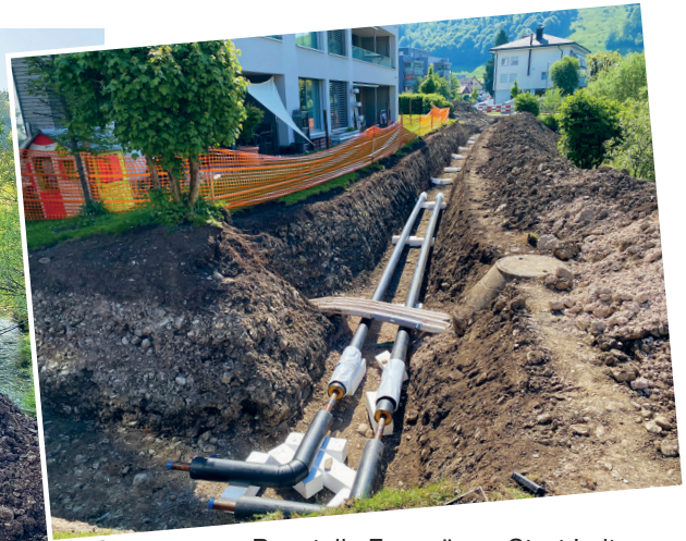
Baustelle Fernwärme Start Leitung