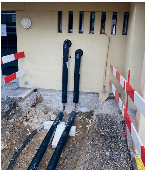
Neubau Fernwärmeanschluss Wohnblock Kornhausstrasse 9