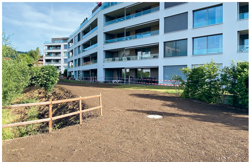
Fertigstellung Obere Allmeind