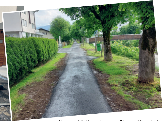
Alpweg Mythenstrasse / Obere Allmeind