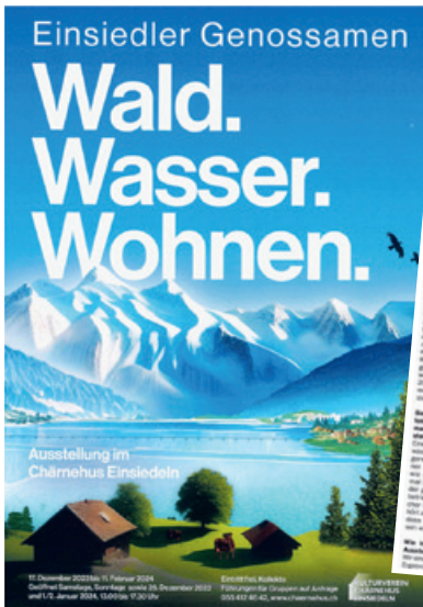
Wald. Wasser. Wohnen. 175 Jahre «Einsiedler Genossamen» und Zeitungsartikel der Ausstellung Chärnehus