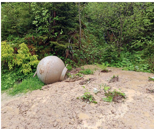
Schaden Wasserbehälter Tritthütte