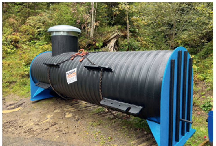
Neuer Wasserbehälter Tritthütte